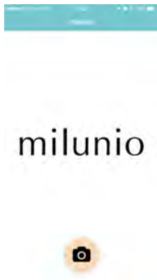
<アプリタイトル画面>