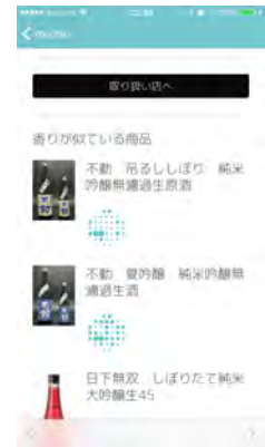
<香りが似ている商品表示>

※ 掲載されている画像は開発中画面のイメージです。実際の画面とは異なる可能性があります。