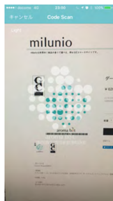
<aroma code リーダー>